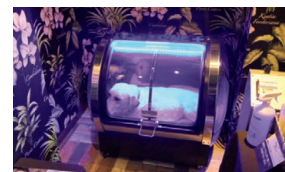
ペット専用酸素カプセル「DOGS ONE」。プロ仕様のセルフシャンプーーム。